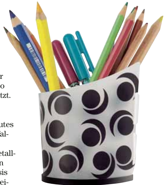
Neuer Folienköcher von Han: lässt sich in einem Standard-Umschlag verschicken.

Auch der neue „Salsa“-Kugelschreiberständer will durch gutes Design und Funktionalität gefallen. Eine großzügig dimensionierte, 55 Zentimeter lange Metallkette bindet den nachfüllbaren Kugelschreiber fest an die Basis und lässt Nutzern reichlich Freiraum. Das mondäne Design strahlt zeitlose Eleganz aus.