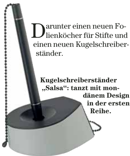
Kugelschreiberständer „Salsa“: tanzt mit mondänem Design in der ersten Reihe.

Mit ungewöhnlichen Ideen, hohem Designanspruch und ausgefeilter Technik neue Produkte zu entwickeln, das ist das Ziel des Herforder Herstellers Han. Sechs Neuigkeiten wird der Vollsortimenter auf der Paperworld vorstellen.